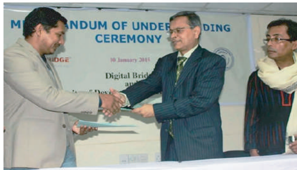
MOU signing ceremony between Digital Bridge and UODA