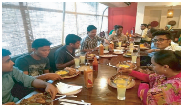
Digital Bridge Team at a get-together in a restaurant