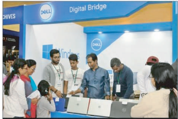
Visitors browse laptops at a stall styled 'Digital Bridge' in a fair organised by Expo Maker at Bangabandhu International Conference Centre in Dhaka on Saturday.