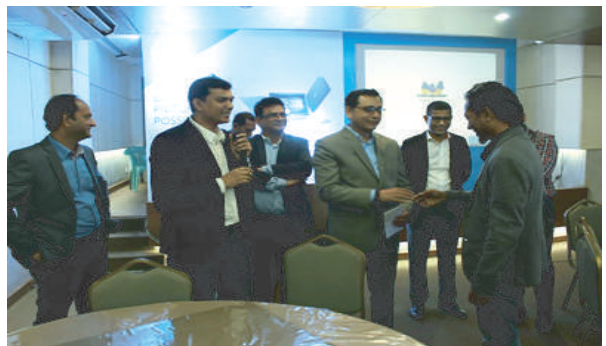
CEO of Digital Bridge is getting Award