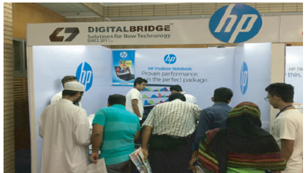
Digital Bridge in the Laptop fair at BICC